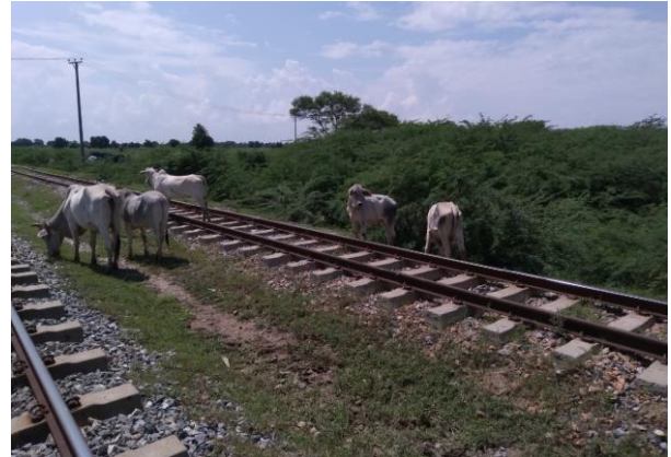
写真-3 のどかな鉄道沿線の風景

Project 事務所、クライアントであるミャンマー国鉄 (MR)の人々と接して思うのは、非常に自立しており意欲的で個人主義に走らず協調性もある。工業製品以外の物価も安く、人件費も安い、だだっ広い平野に、豊かな水源、非常に好感の持てる良い人々で宗教も同じく仏教、政情が安定し続ければ豊かになる大きなポテンシャルのある国だと思っております。新たな拠点をお考えである日本企業には国境地域を除いて個人的にお勧めです。