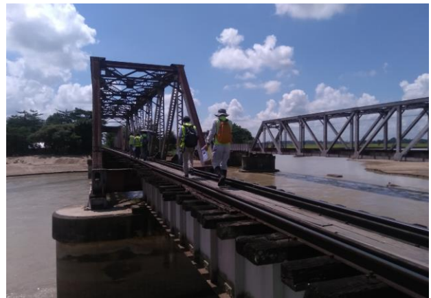
写真-1 路線中間の Swa 駅付近の橋梁既存軌道の調査風景

ミャンマーの一般道、高速道路を通行する実感するのですが、富裕層はまだ少なく感じられることと、渋滞が比較的深刻でないことから道路交通で概ね予定通り移動できることなど、共通して軍事政権を嫌って海外投資から敬遠された結果と思われ、周辺諸国と相対的に発展から取り残された感が現状はあると感じます。今後、ミャンマー国の経済成長にともなって、道路交通に偏っている同国で鉄道による適切な輸送分担は不可欠として、ヤンゴン・マンガレー鉄道の改良・近代化事業が実施されている次第です。