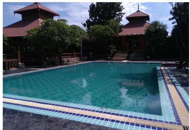
写真-4 Aureum Palace Hotel のプール

ミャンマー国鉄職員、事務所の職員、ホテルの従業員などの人々は、高学歴、英語も、時に日本語をある程度理解できる人(日本留学などの経験者)もいて、途上国にありがちな働かない人より、よく働く人が多い印象です。地方に調査に出かけても各所に大小のレストランや屋台があり外食が意外なほど多いようです。女性が良く働くよう共働き家庭も多く外食産業を支えている一面もあるそうです。給与水準は低く日本の10分の1くらい、高級官僚が500ドル/月くらいの給料に官舎の支給など特権がある程度、関税が非常に高く自動車は日本の販売価格の3倍くらいするのは多くの途上国と共通する事情のようです。トヨタ車、ホンダ、三菱、ヒュンダイ順くらいの頻度で圧倒的に日本製の自動車を見かけます。私が就職した頃の頃に見かけたマーク2、カローラ、プロボックス、ノア、アルファードなど日本で買い替え下取り車などが相当中古車として輸入されているのではないかと推測されます。車輛右側通行にもかかわらず右ハンドルだらけですが、法改正の影響とのことで新車は左ハンドルだけになるようです。外国人の送迎用などに確保された社用車以外では高級