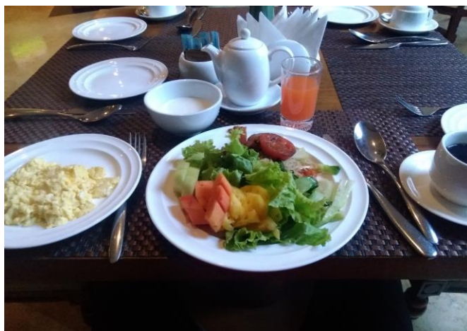
写真-5 Aureum Palace Hotel の朝のbuffet

首都ネピターのレストランでは中華、コリアン、日本食、何でも食べられます。交通事情も悪くないことから内陸のネピターでも刺身などの生鮮魚類も安心して食べられました。同じ仏教国ですから豚も、牛も、鳥も、魚も宗教的な制限がなく地