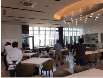
キャンパスレストラン

学生食堂の「菜の花レストラン」としては、朝8:00~10:00、昼10:45~14:00の間営業しており、学生、職員のほか一般の人も利用できるようになっています。朝食は税込み300円の定食、昼は600円でワンプレートに1回のみ自由に盛り付けられるシステムとなっています。このランチは、関西の朝の情報番組「すまたん」(日本テレビ系列)でも隠れたレストランとして紹介されています。夜はイタリア料理の「レストランテ翔21」に衣替えし、コース料理4,000円〜と、高級感のあるレストランになります。見学はその衣替えの最中にお邪魔し、屋外のテラス席なども見学しました。