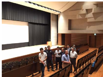
常翔ホールの見学の様子

576席収容の多目的ホールであり、講演会、学会のほか、音楽イベントなども開催可能なこだわった音響施設となっていました。また、3階には一般利用が可能な会議室が2室あり、今回の見学会もその1室を借りて実施しました。