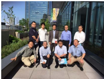
キャンパスフォレストでの記念撮影

知のぎわい空間として、6階・7階吹き抜けのフロアで、380インチの巨大スクリーンが準備されており、プレゼンテーションの場としても活用できる空間となっていました。5階までが低層階空間で、その屋上を100種以上の木々で構成されるキャンパスフォレストもこの6階からのアプローチになります。